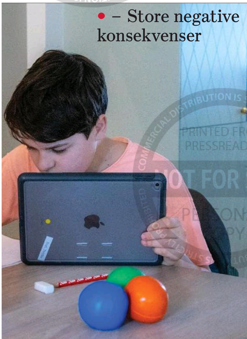
for å komme seg gjennom skoleløpet.