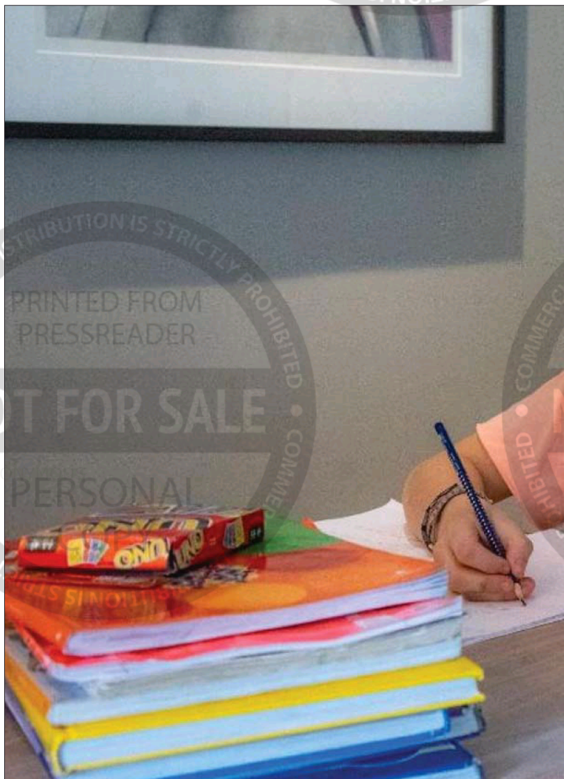
Fersk forskning viser at elever presterer dårligere etter hjemmeundervisning. Nå krever elevene mer dybdelæring

skrift, men også i hvilken utstrekning elevene klarte å henvende seg til mottaker og presentere innhold på en begripelig måte.