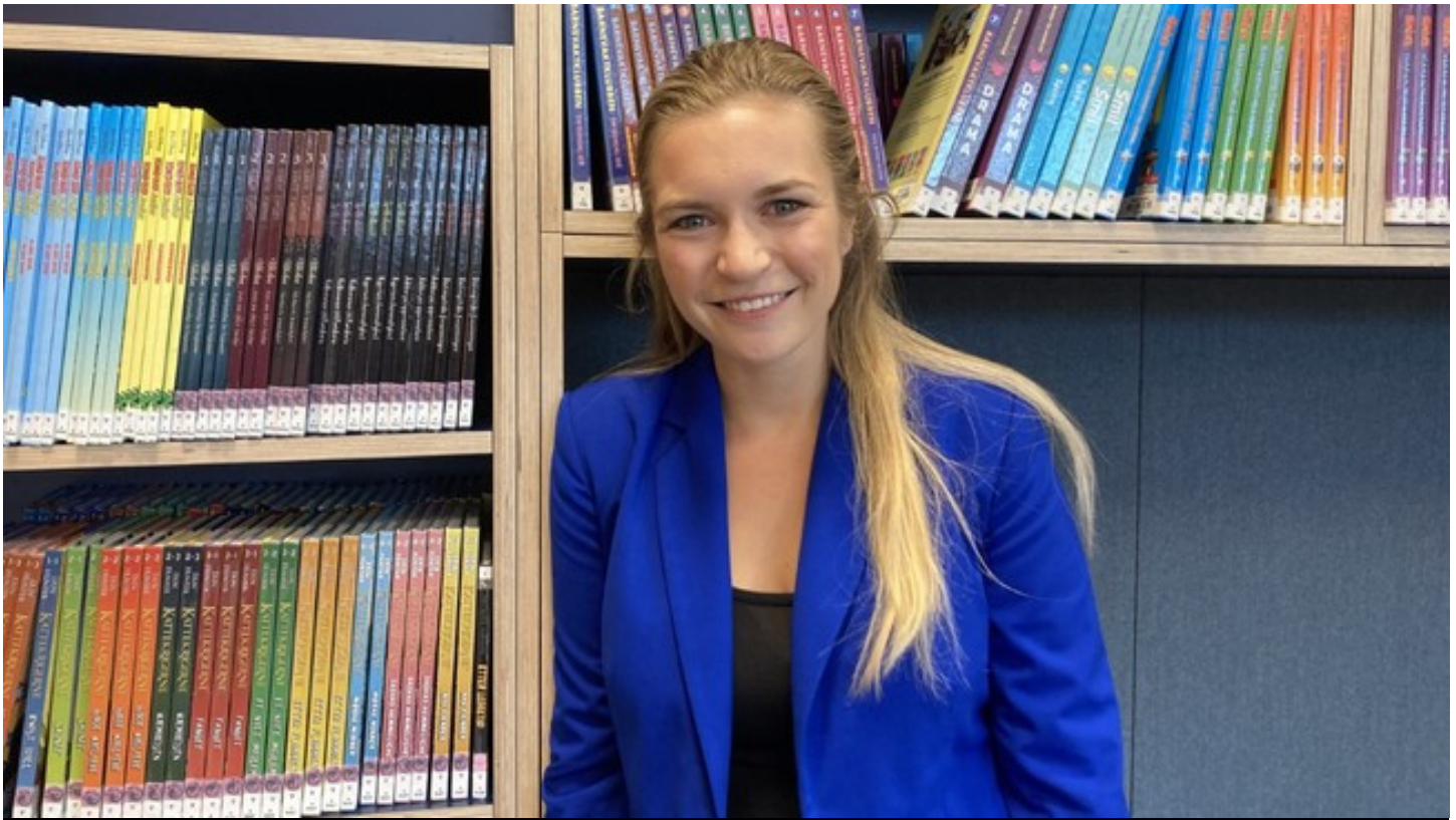
BEKYMRET: Stortingsrepresentant for Høyre, Mathilde Tybring-Gjedde, besøkte Vestli skole, blant annet for å snakke om bekymring for kunnskapshull etter pandemien.